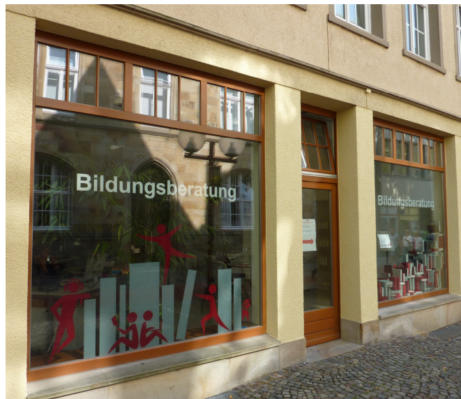
Die Bildungsberatung in der Osnabrücker Altstadt

Die Bildungsberatung bietet niedrigschwellige Zugänge zum Beratungsangebot. Zentral gelegene Räume sorgen für eine gute Erreichbarkeit und Sichtbarkeit. Voraussetzung für eine professionelle Bildungsberatung ist neben dem Büro der Bildungsberaterinnen ein zusätzlicher Raum, um sich für ein intensives Beratungsgespräch zurückziehen zu können. Darüber hinaus sollen die Ratsuchenden die Möglichkeit bekommen, per Internet oder Literatur Recherche gemäß ihrem Beratungsanlass selbstständig und/oder unter Anleitung einer Beraterin durchführen zu können.